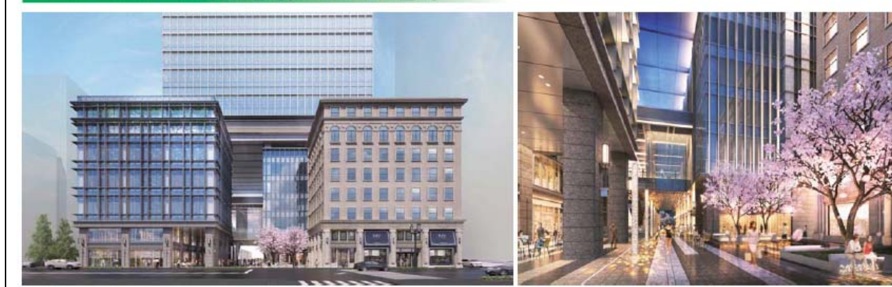
イメージパース(中央通り側からガレリアを望む)

募集人員 30名(先着順) *定員になり次第、締切らせていただきます。あらかじめご了承ください。